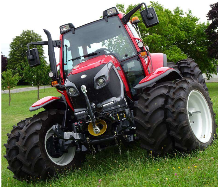
Bergtraktor LINTRAC 80 (Mountain tractor LINTRAC 80)

Anmelder (Registration): Traktorenwerk Lindner GmbH Ing.-H.-Lindner-Straße 4 AT 6250 Kundl